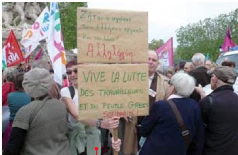
Pour la mondialisation des luttes grecque... et roumaine.

Sont également dans le collimateur des mesures comme la majoration de pension pour les parents de trois enfants et plus, ou des dispositifs propres à la ▶▶▶