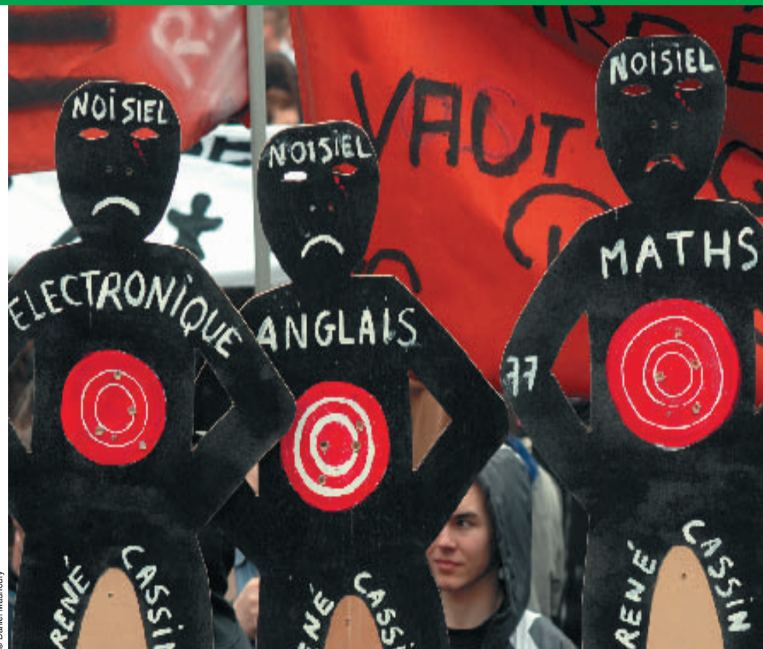
LE PLAN D'ACTION P. 4-5

Ainsi, que ce soit pour la santé, les retraites, les services Suite page 2 >>>