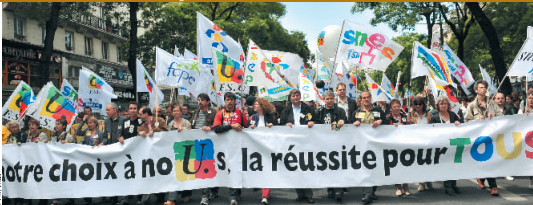
La manifestation nationale du 18 mai a rassemblé 45 000 personnes

Le SNES a remis un certain nombre de propositions au ministre ; l'ampleur des mobilisations et les défis posés au système éducatif français exigent Suite page 2 ▶▶▶