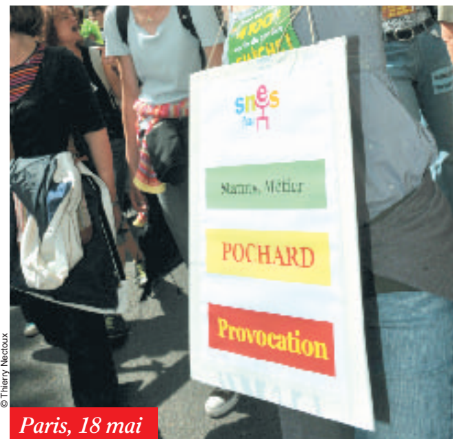
Paris, 18 mai