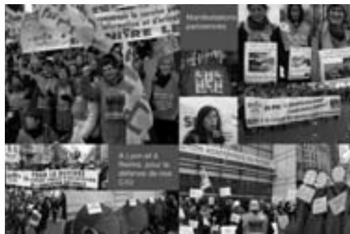
Combats au quotidien

► L'arrêté définissant les modalités et le contenu de formation , présenté en CTM le 16 novembre, ne contenait rien des garanties que la FSU attend sur les horaires, les contenus, les modalités pratiques de la formation. La FSU intervient pour que la DGSIP (1) respecte la note de cadrage actée par le cabinet le 20/07/2016. Les arguments avancés sont d'ordre financier. Pourtant, comment, à budgets constants, les crédits alloués pour deux ans de formation de CO-Psy stagiaires et un an de préparation au DEPS