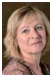
Frédérique ROLET secrétaire générale du SNES-FSU

Plus que jamais, se rassembler et ne pas rester isolé sont une nécessité, c'est pourquoi nous vous invitons à vous rapprocher des syndicats de la FSU et à les solliciter pour vous assister et vous défendre lors des opérations de mutation.