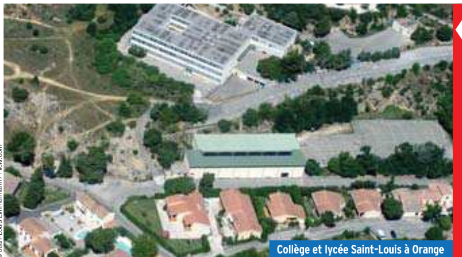
Collège et lycée Saint-Louis à Orange

Les palmarès des lycées donnent l'occasion aux établissements privés de louer les très bons résultats qu'ils obtiendraient. Mais ces établissements réussissent-ils vraiment mieux que les établissements publics ?