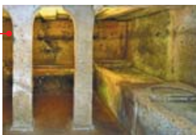
Tombe familiale à Cerveteri.

droit aux plaisirs de la vie. On lui offre l'environnement le plus heureux possible : scènes de banquet, de danse, de musique, de jeux, de sport, de chasse ou scènes érotiques... La nature est foisonnante, des animaux fantastiques ou exotiques assurent la protection des morts ou soulignent leur puissance.