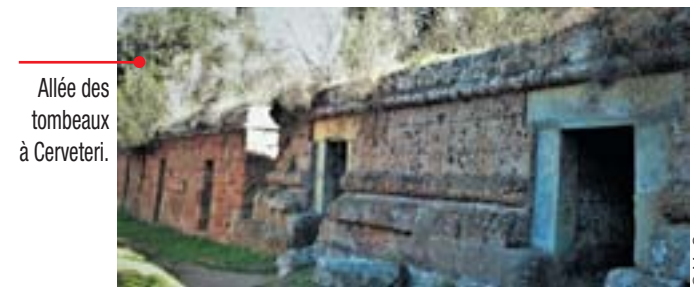
Allée des tombeaux à Cerveteri.

Il faudra attendre le XVIII e siècle, la découverte de Pompéi, l'engouement pour les antiques pour que surgissent des merveilles artistiques extirpées de terre par des « tombaroli » peu scrupuleux. Les nécropoles, les tombeaux, de plus en plus sérieusement fouillés,