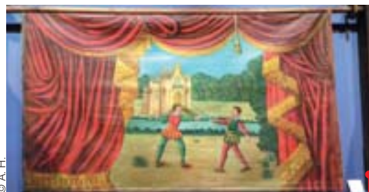
Rideau de scène du théâtre de Louis de Budt, Lille, fin du XIX e siècle. |

Dans la salle des malades de cet hospice fondé en 1237 par Jeanne de Flandre, sont mises en scène plus de 70 marionnettes et des vêtements, accessoires, affiches, peintures et photographies. On découvre aussi deux castelets (scènes où se déroulent les spectacles) et un rideau de scène.