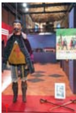
Scénographie dans la salle des malades.

Divertissement des ouvriers, les spectacles de marionnettes à tringle, apparus au XIX e siècle, s'inscrivent dans l'histoire industrielle du Nord et de villes comme Lille ou Roubaix.