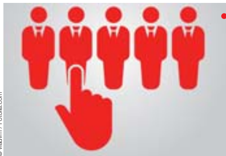
Le tri contre l'avenir.

Dans notre enseignement, nous avons pu mesurer combien un examen national, avec des épreuves terminales évaluées de manière