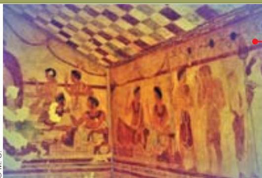
Le banquet, fresque de la nécropole de Tarquinia.

La multitude de coupes, vases, flacons de parfums,