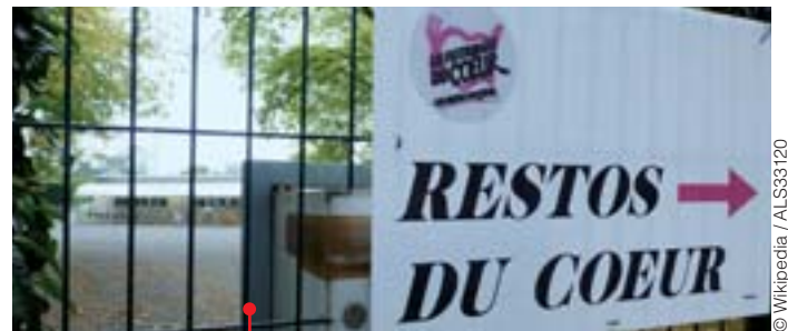
Jeunes et vieux s'y retrouvent.

Et les mesures prises à la rentrée dernière ne risquent pas d'améliorer la situation : réforme des APL et baisse de 5 euros, augmentation de la CSG, gel des emplois aidés, suppression de l'ISF, maintien du CICE, de ses milliards, sans compter les attaques contre le code du travail et la réforme annoncée du chômage.