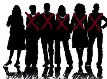
Halte à la casse des services publics d'orientation

Malgré les revirements du Ministère sur les engagements pris, notamment concernant les améliorations de carrière, malgré une volonté délibérée de réduire drastiquement les recrutements en particulier de PsyEN-EDO (-51% en 2 ans), de supprimer les CIO et les DRONISEP et de minorer l'apport des psychologues dans l'École, les PsyEN se sont choisis des représentants, déterminés à faire reconnaître la place de la psychologie et à contribuer au développement psychologique et social, à l'émancipation et à la réussite de tous les enfants et adolescents.