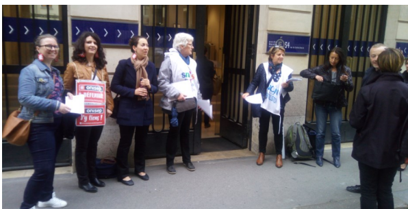
ONISEP et CIO, unis pour tracter devant le MEN

Ces arguments sont entendus par les jeunes et les parents puisqu'à l'initiative du SNES et de la FCPE une déclaration commune faite au CSE a été soutenue par les autres organisations syndicales, les lycéens et les étudiants ( https://www.snes.edu/CSE-du-15-mai-Une-declaration-unitaire.html ).