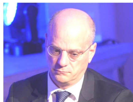
Gribouille toi-même ton Blanquer