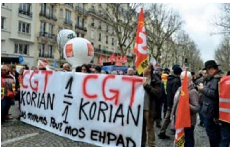
Succès de la manifestation des personnels des EHPAD le 30 janvier dernier.

Un coût élevé n'est pas un gage de qualité. Les exemples abondent. Les témoignages de familles décrivent des