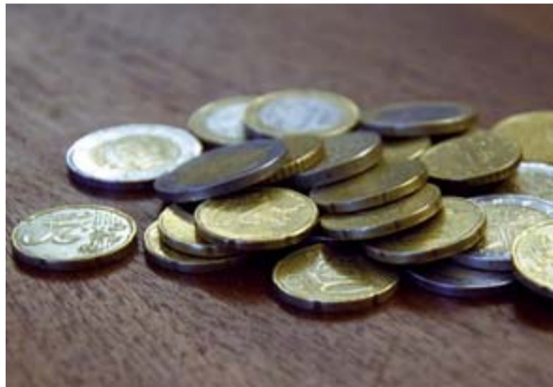
Augmentation de cotisation et de la CSG, gel du point d'indice, report des mesures PPCR, rétablissement du jour de carence... Tout concourt à une nouvelle baisse du pouvoir d'achat.

Au cours du premier rendez-vous salarial du quinquennat, le ministre de l'Action et des Comptes publics a confirmé les inquiétudes du SNES-FSU sur la politique salariale du gouvernement en reportant d'un an de l'application des mesures issues du cycle de discussions PPCR. Il s'agit d'un retour sur l'engagement de l'État inacceptable, entraînant une dégradation du pouvoir d'achat et des carrières des personnels d'enseignement, d'éducation et de psychologie. Ainsi sont reportés au 1 er janvier 2019 le second transfert primes-points sous la forme de cinq points d'indice et au 1 er janvier 2020 la seconde revalorisation des grilles indiciaires. Le gouvernement a choisi également de geler à nouveau la valeur du point d'indice. Pourtant, celui-ci n'avait été revalorisé seulement que de 0,6 % en juillet 2016 et de 0,6 % en février 2017.