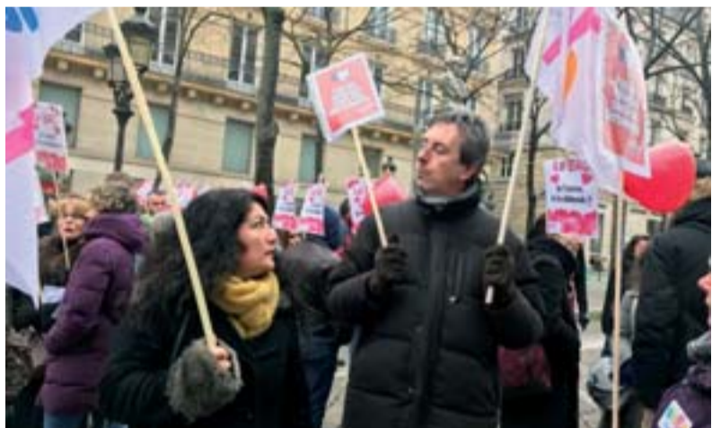
Le SNES-FSU des académies franciliennes présent en force au rassemblement du 14 février.