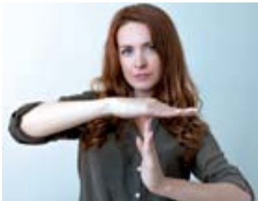
C'est toute une profession qui dit stop au projet ministériel.

Le 29 janvier dernier, après la publication du rapport Mathiot, onze associations disciplinaires, en lien avec la Conférence des associations de professeurs spécialistes, publiaient une lettre ouverte en forme de pétition adressée au ministre.