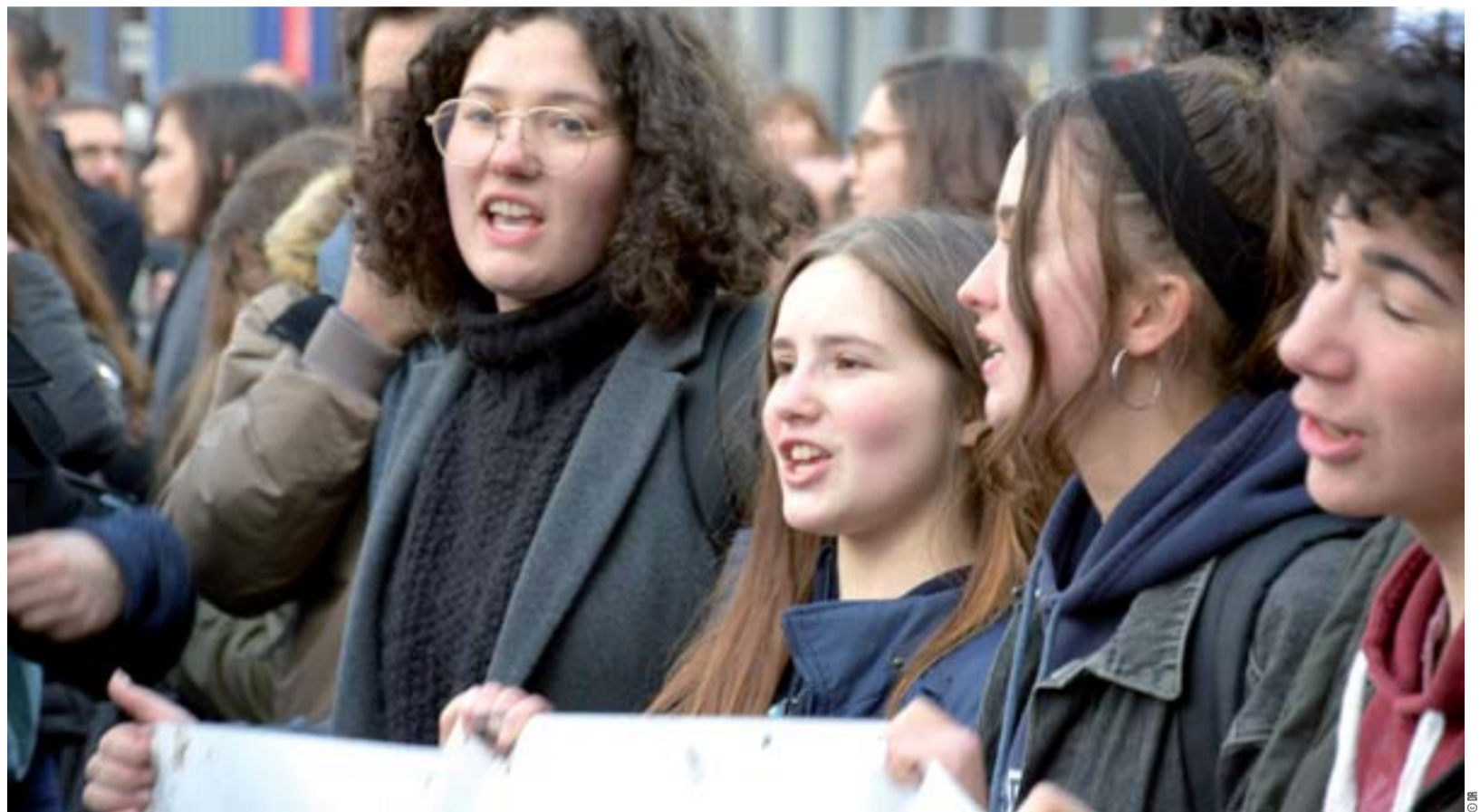
Le vernis craque. Les beaux discours du Président et des ministres n'empêchent pas la prise de conscience. De vrais sujets qui rendent la mobilisation nécessaire émergent.