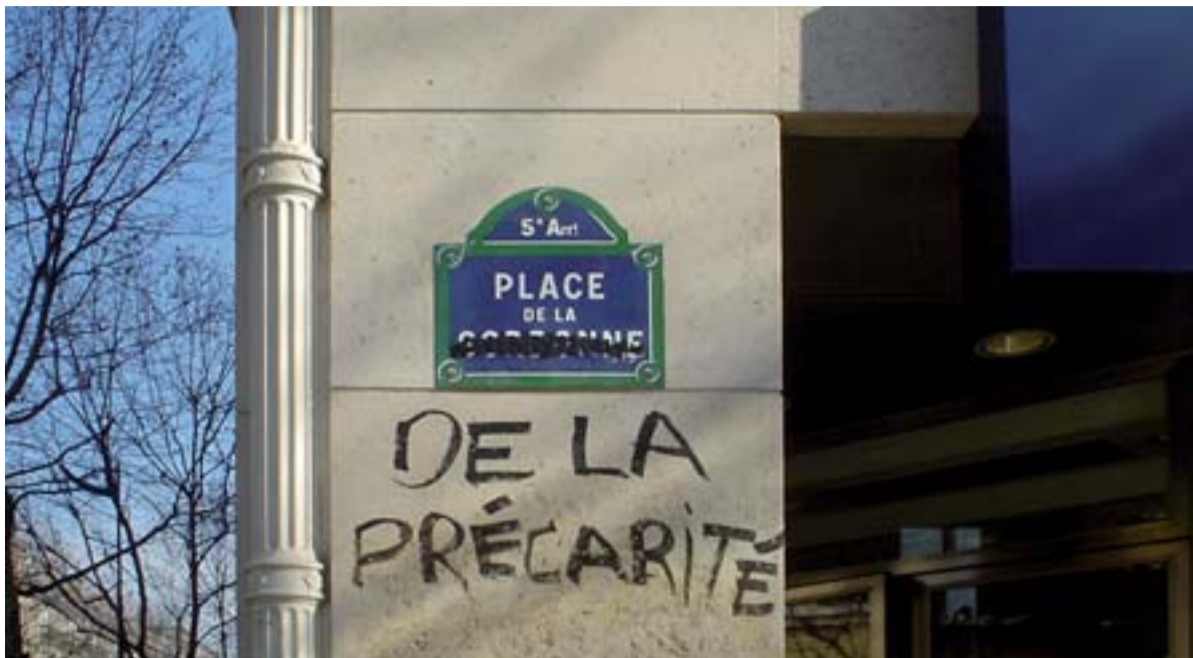
La précarité est un fléau auquel la Fonction publique n'échappe malheureusement pas. La résorption est un de nos combats prioritaires. S'appuyer dessus pour affaiblir les statuts collectifs est l'obsession du gouvernement.

En mars prochain, des annonces seront faites sur la formation et le recrutement des enseignants, mais dès le 16 janvier, le ministre a déclaré : « il y a et il y aura toujours des contractuels en France ». M. Blanquer ne sera pas le ministre qui mettra fin à la précarité subie par les 22 000 contractuels du second degré.