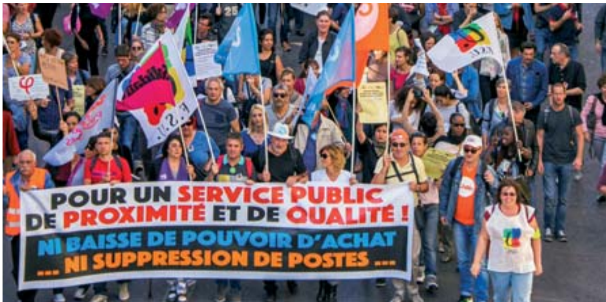
Le 10 octobre 2017, les fonctionnaires mobilisés dans l'unité de leur organisation syndicale pour les salaires, l'emploi et les conditions de travail.

Les premières mesures annoncées ce 1 er février sont issues des réflexions interministérielles « visant à réfléchir sans tabou au rôle de l'État, à l'amélioration du service rendu ». Rémunération au mérite, recours plus fréquent aux contractuels et « plan de départs volontaires » : effectivement, le gouvernement ne s'interdit rien et entend bien accélérer l'imposition des méthodes de management du privé dans la pers-