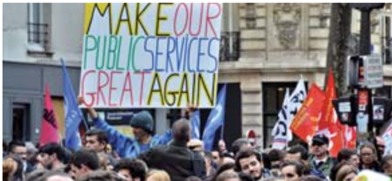
Après le succès de la grève unitaire du 10 octobre, sept fédérations de fonctionnaires appellent à une nouvelle journée d'action le 22 mars.

Ce mouvement doit donner à voir la colère des personnels dont la situation salariale s'est encore dégradée et dont les missions sont remises en cause. Quant aux non-titulaires, la volonté affichée de recourir davantage aux contrats et l'absence de tout nouveau