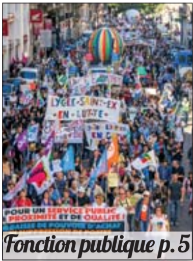
Fonction publique p. 5