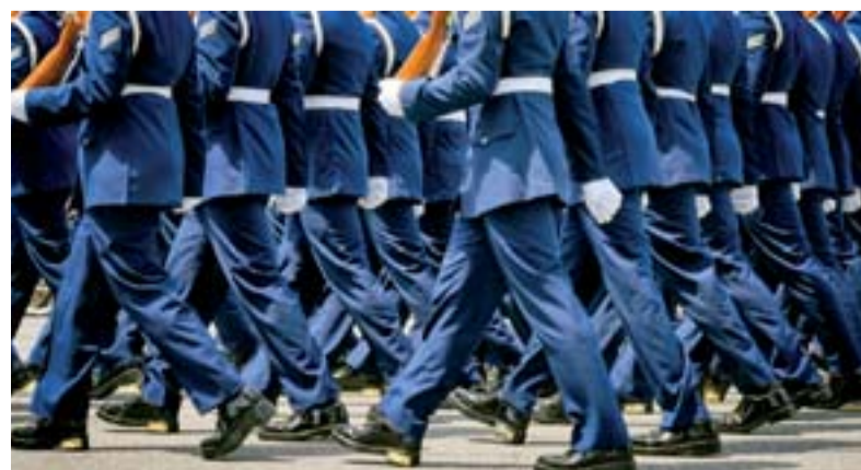
Injonctions et « bonnes pratiques » ne font pas bon ménage avec liberté et innovations pédagogiques.