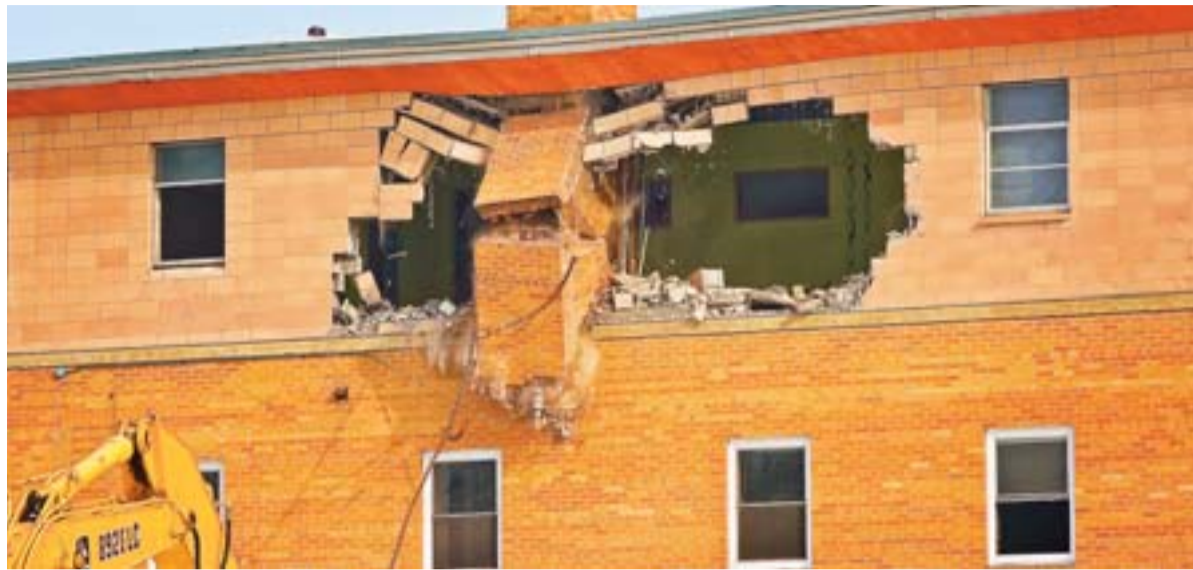
Hausse des effectifs, explosion des HSA, fragilisation des contractuels... Le chantier de destruction bat son plein !

Les Pôles inclusifs d'accompagnement localisés (PIAL) ont été généralisés sans être évalués. La mutualisation des AESH n'est rien d'autre qu'une gestion de la pénurie de moyens humains, au détri-