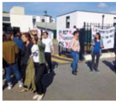
À Barbusse, rentrée perturbée... par l'incurie de l'administration !

Heureusement, une mobilisation qui n'a jamais faibli (entre 80 et 90 % de grévistes durant plus d'une semaine), une couverture médiatique nationale ( Libération , Le Monde , BFM), des actions quotidiennes (barbecue devant le rectorat, délégation au ministère...) et surtout un soutien sans faille des parents d'élèves, ont contraint les autorités académiques à reconnaître que, oui, les seuils académiques existent et sont bien de 25 élèves pour les