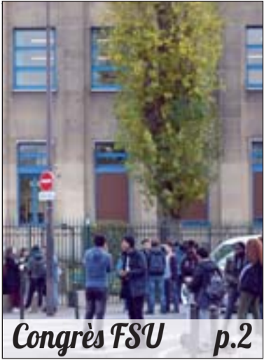
Congrès FSU p.2