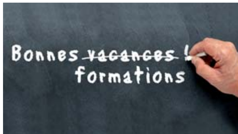
Les professeurs ont besoin de temps pour se former tout au long de leur carrière, pas de formations imposées.