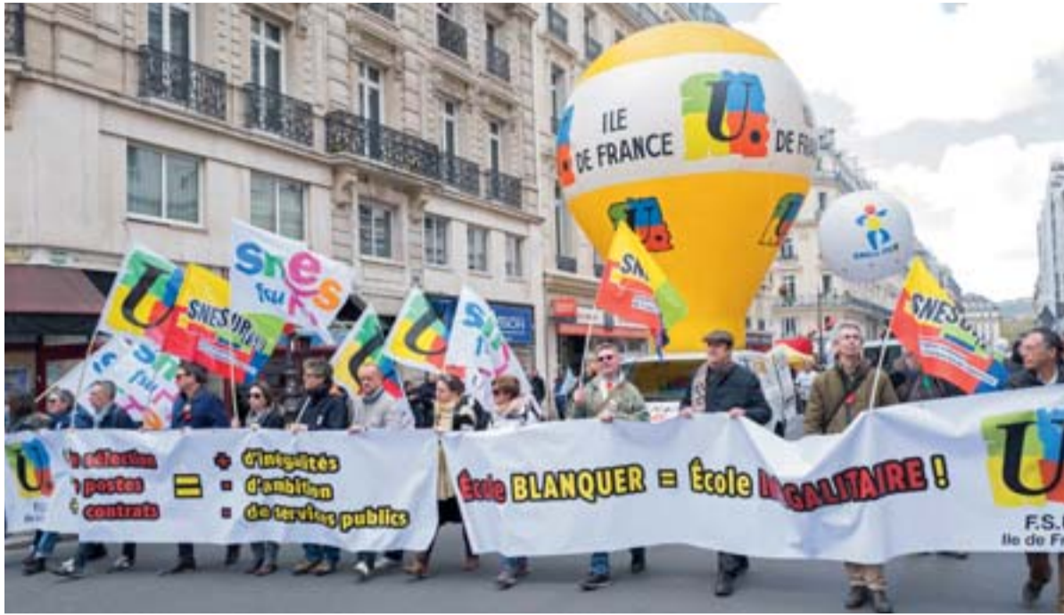
Territoriales, sociales, salariales, les inégalités sont au cœur d'une politique destructrice pour l'Éducation nationale.

J.-M. Blanquer, ministre de « la Justice sociale » : cette affirmation figure en bonne place parmi les éléments de langage du ministère. Mais les apparences sont trompeuses et ne résistent pas à la confrontation avec le réel.