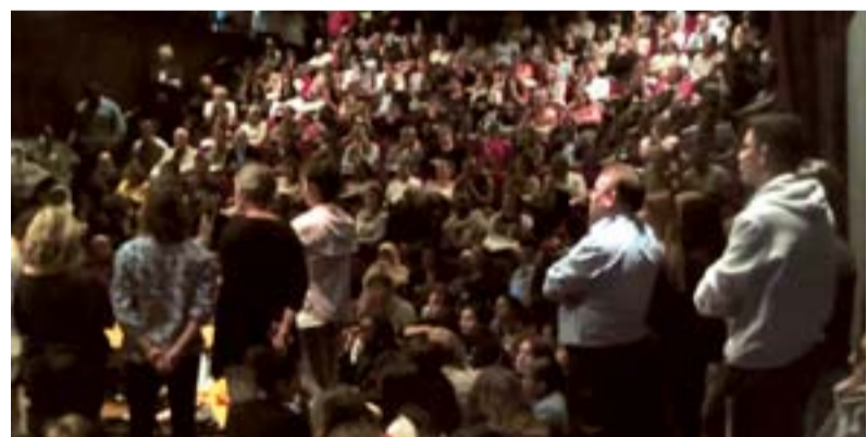
Les enseignants ont été soutenus dans leurs actions par plus de 300 parents d'élèves.