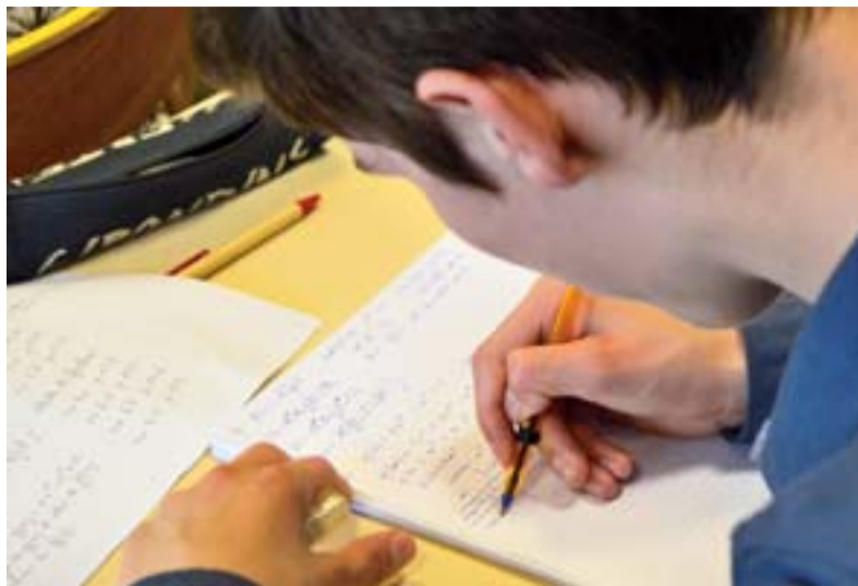
Les élèves devront plancher sur des épreuves dont on ne connaît toujours pas les contours.

L'année dernière, le ministère présentait ces épreuves communes comme plus justes, car standardisées au niveau national sur le modèle de la banque de sujets des épreuves de compétences expérimentales (ECE en S et STL) ou des concours de recrutement des enseignants. On apprenait ainsi qu'il y aurait « plusieurs centaines de sujets » susceptibles de tomber le jour de l'évaluation et que