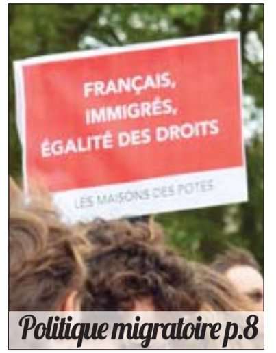
Politique migratoire p.8

L'Université Syndicaliste, le journal du Syndicat national des enseignements de second degré – numéro 790 du 21 septembre 2019