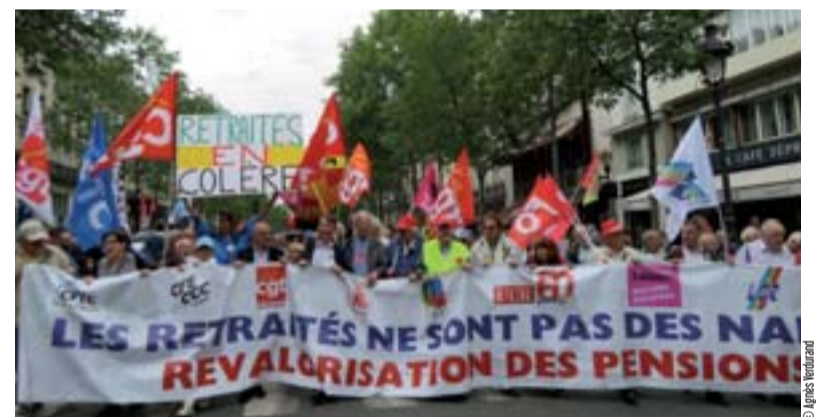
Le groupe des 9 appelle à une journée d'action nationale pour revaloriser les retraités.

Par ailleurs, la réforme des retraites, aux conséquences désastreuses pour les salariés, impactera les retraités