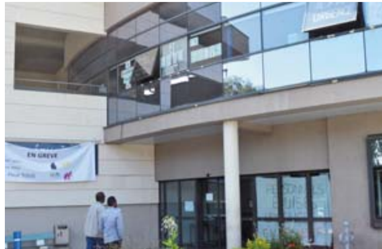
Les annonces de la ministre de la Santé sont jugées très insuffisantes. Les personnels des urgences ont décidé de poursuivre leur mobilisation.

La poursuite de la grève des urgences prouve que la loi adoptée en juillet ne prend pas la mesure de la crise. Mais le « pacte de refondation des ur-