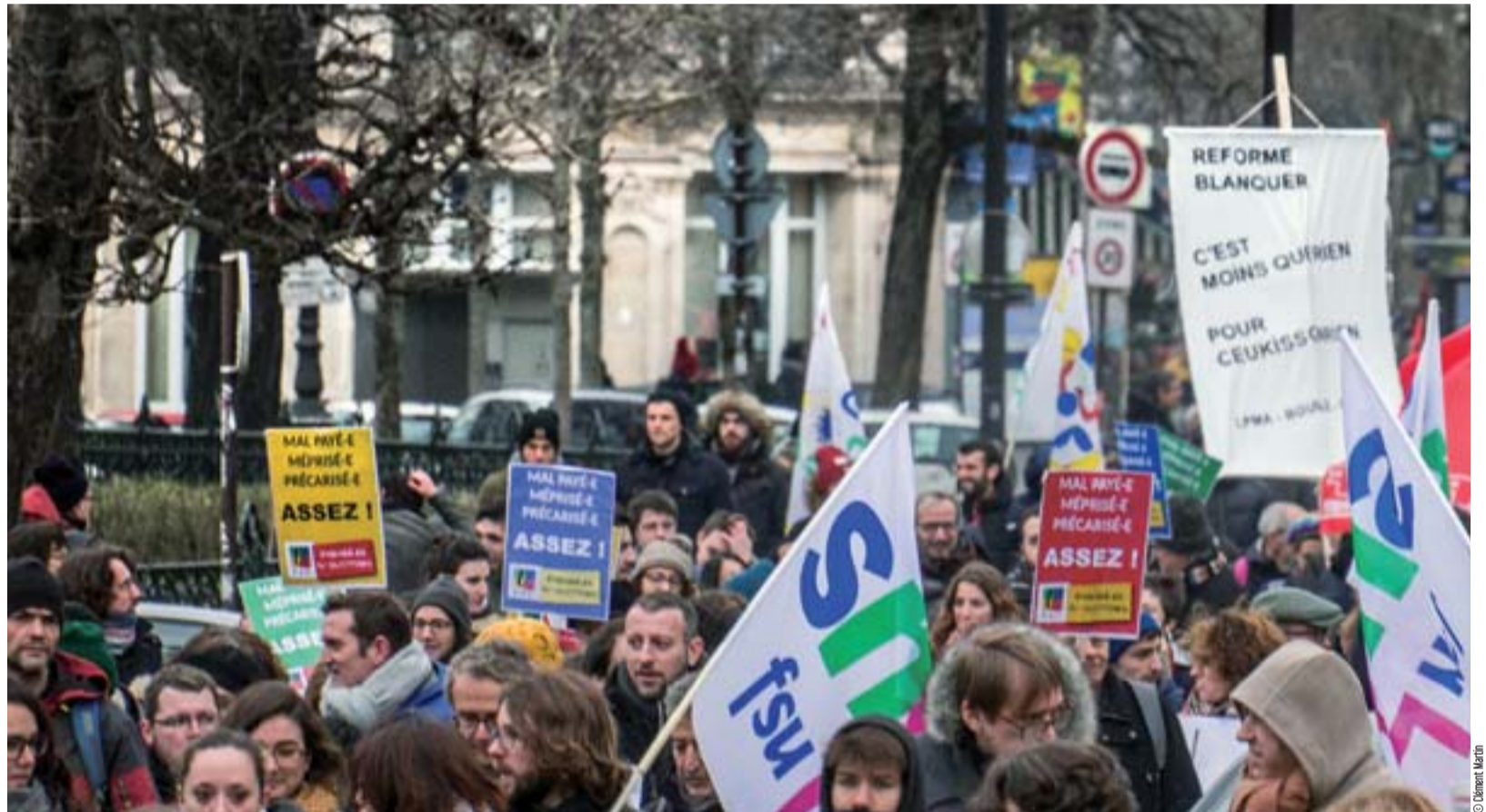
Salaires, retraites, Fonction publique, les attaques sont nombreuses et nourries. C'est un véritable plan d'ensemble dont l'objectif est de détricoter, de rogner, de réduire le bien commun et la solidarité entre les générations et les citoyens.

Deux images de la rentrée se dessinent : celle du ministre, idéale ; et celle que vivent les personnels au quotidien.