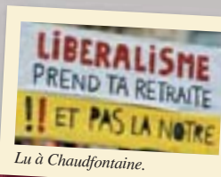
Lu à Chaudfontaine.