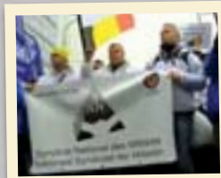
Bruxelles, les militaires manifestent.