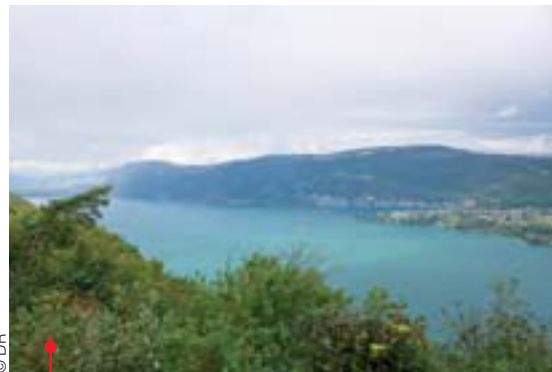
Lac du Bourget, col de la Chambotte et la musique en plus...

• faire découvrir la musique de chambre grâce à des dispositifs de médiation pour tous, inédits en musique classique avant, pendant et après les concerts.